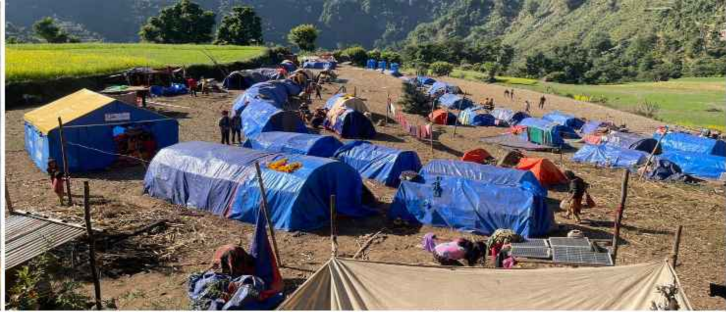
भूकम्पमा विस्थापित नागरिकहरुको बस्ती, नलगाड