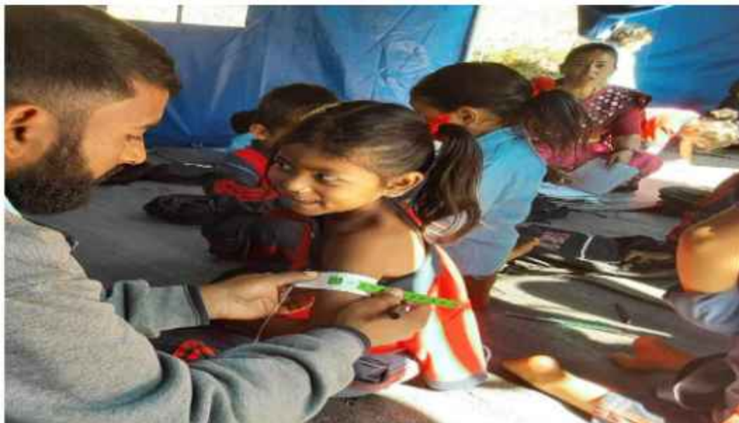
पोषण अवस्थाको पहिचान