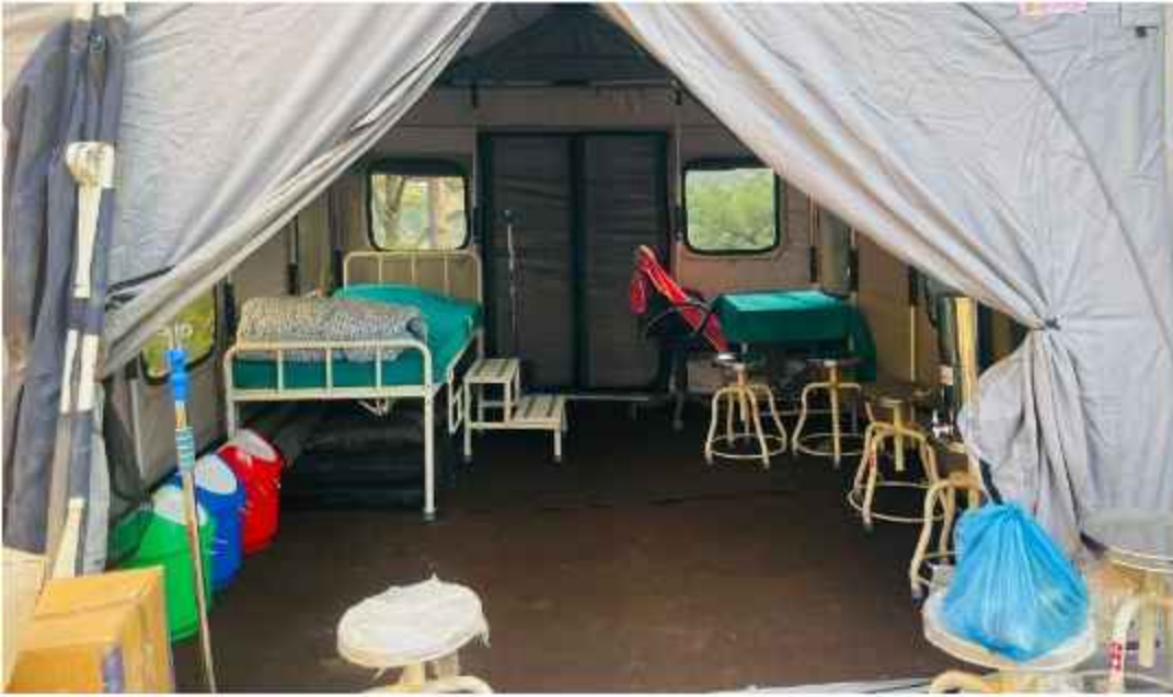
भूकम्प प्रभावित क्षेत्रमा तयार गरिएको अस्थाई अस्पताल